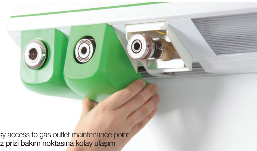
Easy access to gas outlet maintenance point Gaz prizi bakım noktasına kolay ulaşım