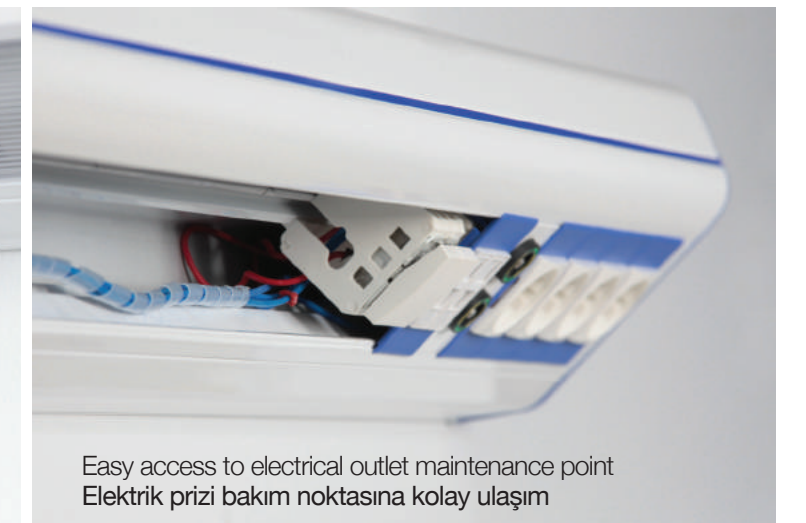
Easy access to electrical outlet maintenance point Elektrik prizi bakım noktasına kolay ulaşım