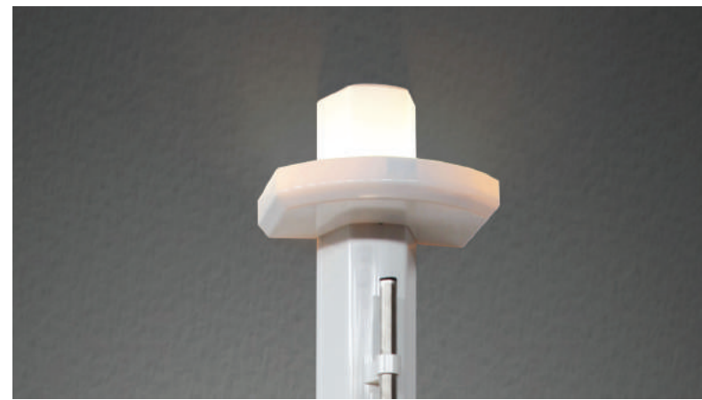
Lighting unit provides comfortable and efficient lighting Aydınlatma ünitesi rahat ve verimli aydınlatma sağlar

Tüm komponentler modüler özelliğindedir. Daha sonra oluşacak hastane gereksinimine göre elektrik prizleri ve gaz prizlerini artırma ve azaltmaya olanak sağlayacak şekilde dizayn edilmiştir. Teknik servis hizmeti için sistemin durmasına gerek yoktur. Sökülebilir tüm metal parçalarda topraklama mevcuttur.