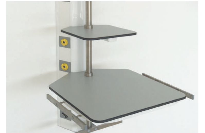
Easy to clean compact shelves Kolay temizlenebilir kompakt raflar